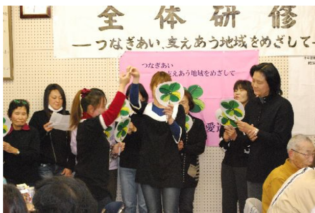
「世界で一つだけの花」の合唱

★人前で歌うなんて何十年ぶりの事で緊張しまくり「あっ！」という間に終わった感じでした。練習期間も短く年のせいか声も出ず、音程もはずれていても気にせず、久しぶりに