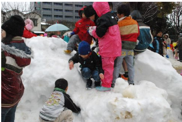
雪山によろこぶ子供たち

午前8:30から虹のふれあいセンターのボランティア5名で「炊き込みご飯」約120食作り、11:00より販売しましたがアットという間に完売、新市長も顔を見せていた