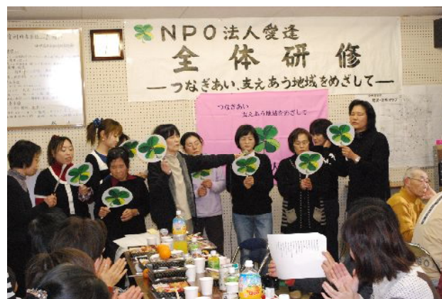
ヘルパーさんやケアマネさんの合唱②