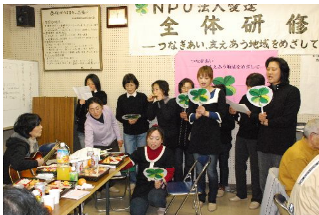
ヘルパーさんやケアマネさんの合唱①